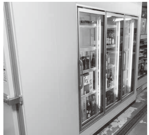
補助金を活用して導入した冷蔵冷凍庫

【今後の展望】 これからも、様々な経営課題に柔軟に対応できるように努力して参ります。また、東京の寿司店で長年修業を積んできた後継者（五代目）の考える新たな事業展開「高付加価値化」「地域外顧客の取込み」に向けて、事業計画策定や補助金申請にチャレンジし、未永く地域やお客様に必要とされ、喜んでいただける企業を目指していきたいと考えています。