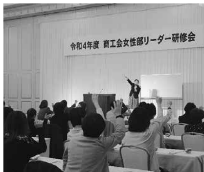
参加型で楽しい雰囲気の研修会となった

「魅力ある女性部づくり」と『次世代リーダーの育成』について」と題し、所属する女性部や県女性連での補助金を活用した取り組み事例を交えて話され、今後の女性部活動を地域経済の一助とするために参考となる講演となった。