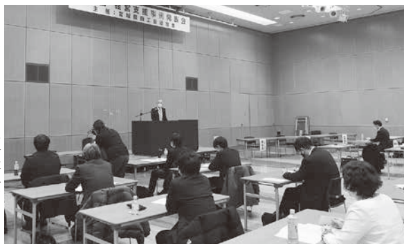
講評を受ける発表者

審査を務めた担当講師からは、支援する上で経営指導員自らが心掛けたこと、工夫した事、苦労したことが明確であり、定性的な成果が達成された事例が多かった一方、今後はより独創的な取り組みにより商工会ならではの差別化された支援が必要となること等、今後の企業支援に向けて厳しくも力強いアドバイスが頂戴した。