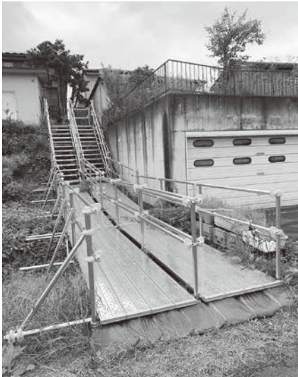
店舗裏に設置した階段

住所：加美郡加美町字町屋敷二番19番地1 TEL：0229-67-2002 FAX：0229-67-2010