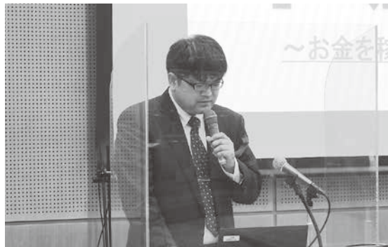
最優秀事例を発表した千葉主任主査

各開催日とも、コロナ禍や物価高騰などの影響により厳しい地域経済環境を乗り越えるための対応策の提案、販路開拓や事業承継に取り組んだ