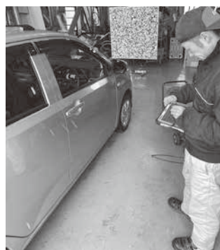
「サポカー車」の自動ブレーキ整備

商工会が主催する「経営計画策定セミナー」等へ参加するとともに、商工会からは事業計画策定に関する助言、効果的な補助金活用提案と申請支援を頂き、これまでに「ハイブリット車対応のエンジン燃焼室洗浄サービス」「楽ちんメンテナンスリース」「サ