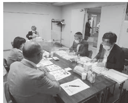
自社商品を熱心に説明する事業者

所属する商工会の担当経営指導員等もサポート役として同席しながら商談会は進められた。