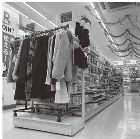
新業態「コンビニ・ブティック」

セミナー情報や拠点情報は Web サイトから www.yorozu.miyagi-fsci.or.jp