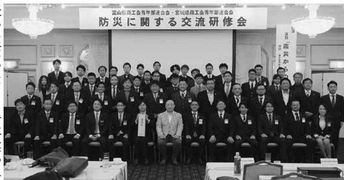
講師を囲んで参加者全員で集合

援いただいたことで事業の早期再開に繋がったこと。また、逆に日本各地で頻発する豪雨災害被災地へ出向き、支援を行ってきたことなどを話し、平常時からの防災・減災に関する情報共有だけでなく、災害時における対処等の知識の強化と迅速な連携の必要性等について改めて認識させられた。続く第二日目は松島町へ向かい、遊覧船で湾内を周遊した他、松島海岸通りに面した土産物店店舗等の復興状況を確認した。二日間を通し、青年部ネットワークを軸とした協力体制を再確認するとともに、復興支援の先にある地域課題について理解を深め、大変実りある交流研修会となった。