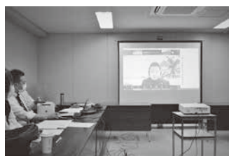
オンラインで開催したセミナー

インボイスとは、「要件を適格に満たした請求書等」で、その要件とは「売り手」が「買い手」に対し正確な「適用税率・消費税額等」を伝