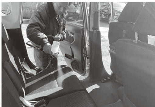
車内抗菌化作業の様子

当社では代表役員をはじめ、整備記録簿の記入に必要な整備主任者資格をメカニック作業員全員が保有しており、常に整備主任者が在籍している営業体制により、高技術かつ迅速な整備対応を行っております。