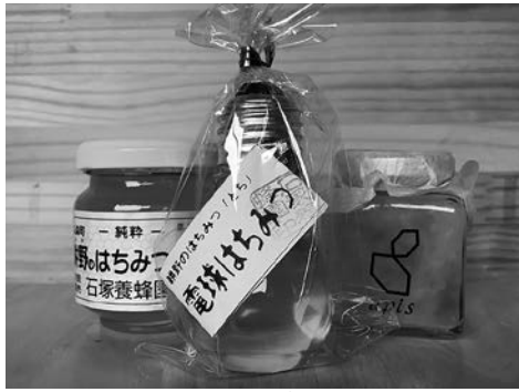
耕野はちみつ商品の数々

また、これまでの仙南地域での採蜜に加え、遠く秋田県の国有林での採蜜も行っており、アカシア・とち・百花・菜の花・りんご・そばなど様々な特徴のある蜂蜜を取り扱っ