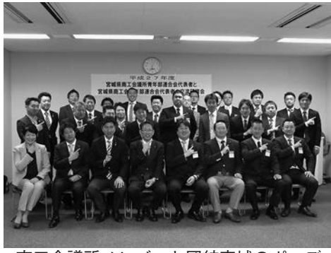
商工会議所メンバーと団結宮城のポーズ

会長三名がそれぞれ委員長を務める震災復興委員会、企画運営委員会、情報委員会の活動を報告し、最後に小松会長から本県青連全体の事業について総括報告を行った。