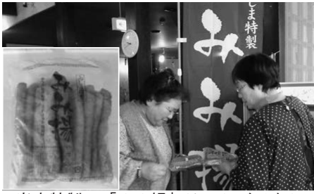
当店特製の「みみ揚」はいかがですか

◆取り組むキツカケ 当店は、昭和十八年以前より加美町宮崎で三嶋八百屋の屋号で創業し、現在では宮崎地区内唯一の豆腐屋として営んでおります。 創業以来、地場産大豆を使った豆腐「みやざきそだち」をはじめ、手づくりこだわりの商品でおお客様にご愛顧頂いております。 その商品の中で、これまで商品名も付かず、無地透明の袋で販売していた細長いスティック状の油揚げが、「そのまま焼くだけでお酒のつまみにな