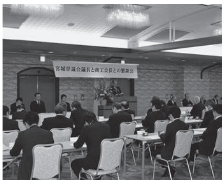
宮城県議会議員との懇談会の様子