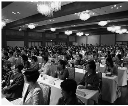
県下商工会女性部部員が集まった昨年の交流研修会の模様

宮城県内の商工会女性部は地元商工業の発展と魅力ある地域づくりを目指して多彩な活動を展開しています。