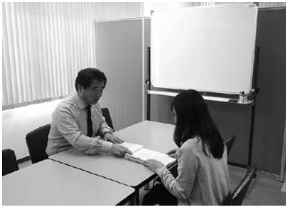
サテライトの相談室

宮城県よろず支援拠点はこの四月から三期目に入りました。昨年度の当拠点は、会員皆様のご理解とご協力により、全国四十七拠点の中でも相談実績や満足度調査等で非常に良い結果を出すことができたものの、それに伴って相談依頼が日に日に増加し、皆様からのご相談に迅速な対応が出来かねる場合もありました。そこで、この状況を改善するため、これまでの県商工会連合会の事務所近くに「サテライトオフィス上杉」を四月に開設し、弁護士や特定社会保険労務士等、強力な新メンバーを加え、増加が見込まれる相談依頼に対し、より迅速に、よりの確に対応できるような体制を大幅に強化いたしました。