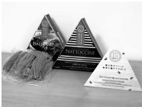
開発された納豆米粉パスタ

食卓でもご飯に替わって麺類の比率が増加していることから、健康志向が強い層に対して新たな商品提案が可能となった。納豆のネバネバが嫌いな外