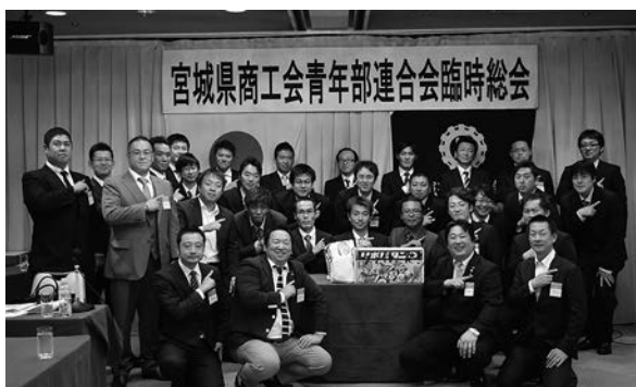
臨時総会終了後、「団結宮城」のポーズ

去る十月二十二日、KKRホテル仙台において、平成二十七年宮城県商工会青年部臨時総会が開催された。今年度、県青連が創立五十周年を迎える節目の年にあたることから、五十周年記念事業の事業計画(案)及び収支予算(案)、実施に伴う収支補正予算(案)が上程され、審議の結果、満場一致で原案どおり可決承認された。承認された「宮城県商工会青年部連合会創立五十周年記念事業」は平成二十八年二月十一日(祝・建国記念の日)に江陽グランドホテルにて開催される予定である。