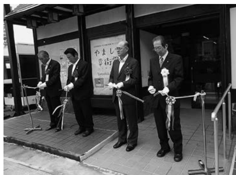
やました幸街堂開所式の模様

「やました幸街堂」は、焼肉店だった約一〇〇平方メートルの空き店舗を借りて、無料で利用できる給茶機の設置や、