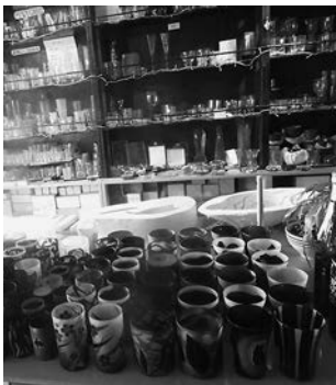
補助金で購入した設備を用いて製造されたガラスの数々(手前)

あわせて、持ち出し可能なサンドブラストの機械を購入し、道の駅やイベント会場などへの出張体験教室で実演できる環境も整備した。 今後は、従来の顧客層よりも幅広い客層に向け、サンドブラストワークショップなどを行い、新商品の開発、販売体制の強化に取組む予定である。