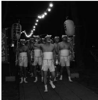
装束姿の裸参り一行

今から四十四年前、小牛田町商工会(現遠田商工会)では町おこし事業について検討してありました。小牛田といえば「小牛田まんじゅう」。また、藩政時代から安産の神様として東北地方に広く知ら