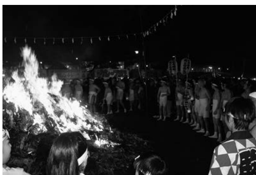
お焚き上げを囲んでの様子

かと当時の商工会青年部が中心となって「どんと祭」を実施したのが「ごたどんと祭」の始まりです。実施には、山神社や周辺住民、関係機関等の理解を得るため約三年を要しましたが、昭和四十九年の初回開催から今年で四十二回目を迎え、今年では参拝者数県北一といわれる「どんと祭」となりました。