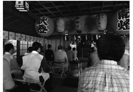
黄金山神社での祈祷

初日の目的地である小網倉浜では、地元関係者が迎え、「牡蠣の水揚げ」や「穴子の籠上げ」、「生簀での釣り」の三つの漁業体験を行い、参加者は慣れない作業に苦戦しながらも、海の豊かさを実感していた。次に語り部の案内のもと観光名所を回り、夕食は、