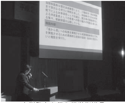
事例発表を行う経営指導員

本発表会は、会員企業の経 営課題の解決に向けた改善策 や経営戦略の提案等について 経営指導員が研究・検討を行 い、経営力向上の取組にどの ように関わり、どのような役 割を果たしたのか、その支援 事例を発表することにより、 経営支援能力の向上につなげ