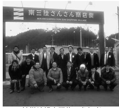
被災地視察研修の参加者