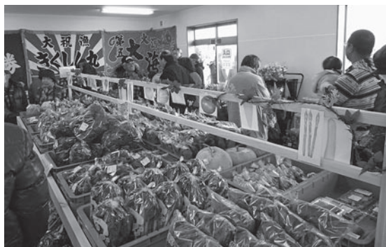
1月18日荒浜築港通りにオープンしたふれあい市場風景

仮設店舗では、それぞれに任意の管理組合を組織し、自主管理・運営を行うこととなっており、先日のふれあい市場のオープニングに際しても、組合より要望のあった広報支援・イベント費の助成など、商工会として取り組める