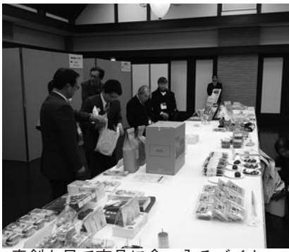
真剣な目で商品に食い入るバイヤー

去る二月八日(水)、ホテルモントレ仙台において全国商工会連合会との共催により「ニッポンいいもの再発見! 宮城地区商談会」を開催した。本商談会は、買付け意欲のあるスーパールのバイヤーと販路拡大を目指す県内商工会会員等が折衝する場であるとともに、商談を通じ商品評価やマーケット情報を直接得ることが出来る充実した内容と