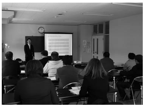
企業の持つ強みを真剣に考える受講生