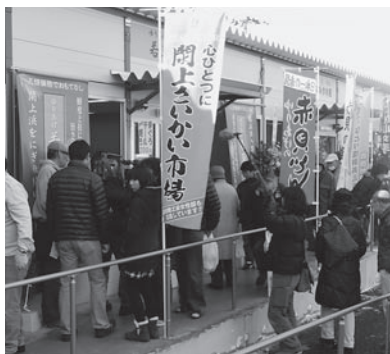
にぎわいが「さいかい」された市場

「のぼり旗」、更には植栽を施設内に飾るなど、女性部らしい応援もあって、当日はオープンを心待ちにしていた大勢の買物客で賑った。