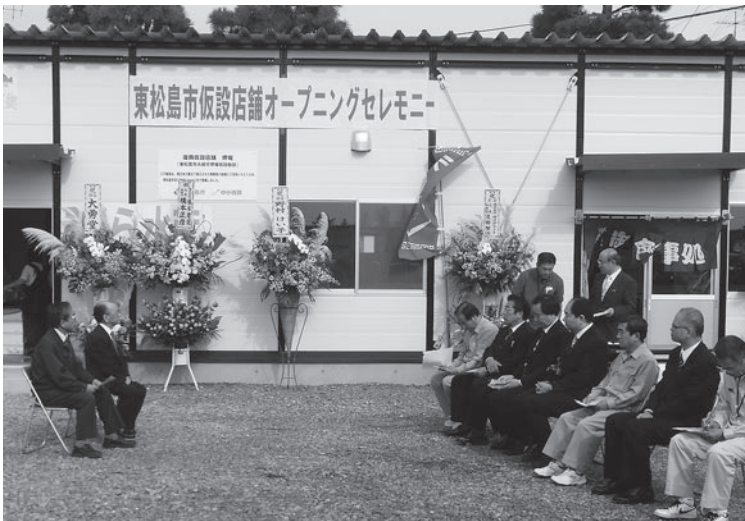
オープニングセレモニーの様子

東松島市商工会では、会員八五〇名中、約九割が被災し、まだ二割の会員が営業再開できない状況である。 このような中、商工会では十月十七日、中小企業基盤整備機構からの支援を受け、市