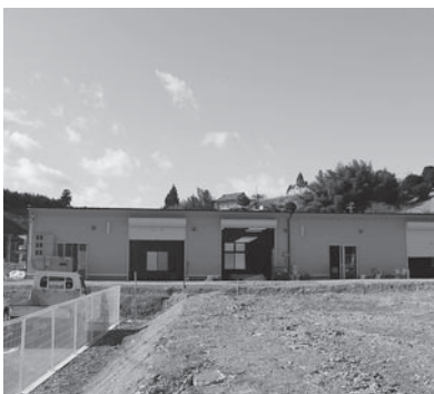
本格稼働に向け準備する加工場

気仙沼地区では「仮設施設整備事業」を活用し、三十九ヶ所の仮設店舗及び工場が営業を再開しつつある中、この度、唐桑地区でも初の仮設工場が完成した。 この工場は津波により自宅及びわかめ加工場や船舶までも流失した会員二名が共同で、わかめの漁期である二月中旬を目標に昨年六月より計画した。 ようやく完成した建物は、延べ床面積三七〇・九九㎡の木造一階建、内部は作業工程を考慮した構造となっており、二月二日には関係者を招き、本格稼働に向け準備する加工場 待して落成式を行った。 入居する事業主の一人は「震災後一年が経過しようとしているが、ようやくスタートラインに立てたような気がする。この地で事業再開が出来たのは、全国の各地より数多くのご支援や協力によるのが大きく、このことに対するお礼は、美味しい三陸産わかめを全国の消費者にお届けすることで恩返しとしていきたい」と熱く語っていた。 一方、本吉唐桑商工会と気仙沼商工会議所は、地域復興のため、平成二十四年度『中小企業等グループ施設等復旧整備事業』を活用し、被災した事業者が早期に事業が再開出来るよう、事業規模の大小や、会員非会員を問わず、市内の中小企業者を対象に募集を行なった結果、四二六事業所が申込みを行なった。 今後は、平成二十四年度補助事業申請への支援を行って行く予定である。