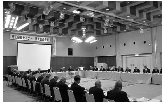
被災地の現状に耳を傾ける参加者

げていただきたいと訴えた。引き続き開催された商工会長会議では、被災地の会長が今なお進まぬ現状を紹介し、国・県に対して二重債務問題をはじめ、グループ施設等復旧整備補助金の拡充等加速化した支援策の実施を切に願った。