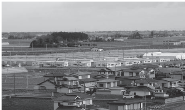
巨理東郷に开店した仮設店舗全景