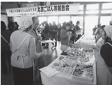
丸森ごはん等報告会の様子

◎地域の商工業の状況はいかがですか。 小売業については、基幹産業である水産業の衰退と相まって厳しい状況が続いており、更に、石巻郊外の大型店出店等により購買の流出に歯止めがかからず地域経済に深刻な影響を及ぼしております。