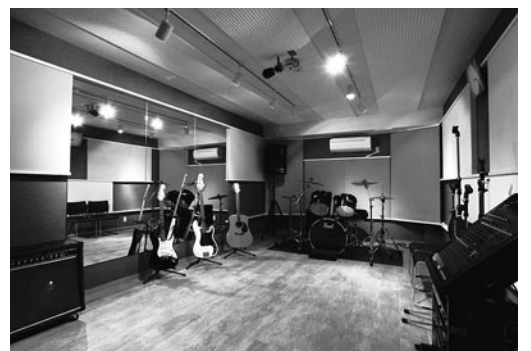
防音工事がされたリハーサルスタジオ

今後は高齢化社会に伴う余暇時間の多様化、ホームシアターの普及等更なる市場拡大が見込まれる事と期待しております。 公共事業依存から脱却し建設業のモデルケースとなるよう情報発信し、地域社会の発展に寄与する企業として邁進して行きたいと考えております。