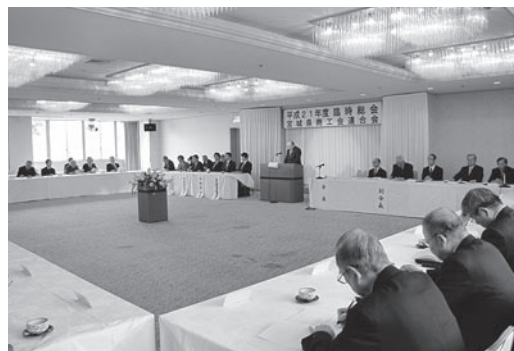
県下33商工会長等が出席

主な審議内容としては、平 成二十一年度の事業計画（案） について、巡回訪問の強化と 財政基盤拡充を図るための具 体的方策や、地域力連携拠点 事業に代わる「中小企業応援 センター」の実施による中 小・小規模企業への支援強化 等重点事業について審議がな され、提案された七議案は、