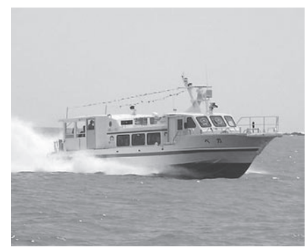
再開した金華山定期航路

◎商工会が取組む街づくり事業についてお聞かせ下さい。 当町は、みなと祭りや秋刀魚収穫祭など年間を通じて多くのイベントを実施しており、シーズンには多くの観光客で賑わいます。 また、昨年度商工会では、地域資源∞全国展開プロジェクトにおいて、観光事業の目玉として「女川どんぶり」を開発しました。 今後は町内にある各種スポーツ施設を有効活用して、民宿組合等との連携による地産地消を前面に打ち出した滞在型観光を目指し、一人でも