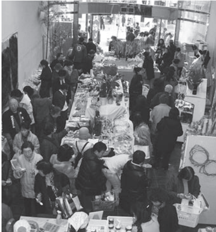
大勢のお客で賑わうアンテナショップ

農林水産省の採択を受けて「地方の元気再生事業」に取組み、丸森町に實際来て見る・遊ぶ・食べる等体験しファン（リーダー）になっていただくことで、地域の経済効果を高め、いく「丸森ブランドディング・ツーリズム」の構築を図るための事業を実施した。