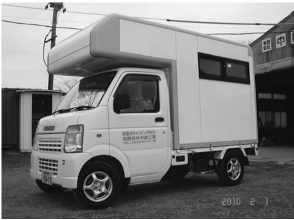
軽トラックの脱着式キャンピングBOX

当社は、地元で軽量鉄骨加工業を営んでおり、高層ビルに取り付ける避雷針が主な製品でしたが、製品寿命が長いため受注サイクルは長期化し、売上は低迷しておりました。