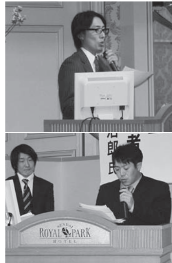
発表する青年部長

評価を受けるに至るまでの経緯、後継者が従来の家業を変革することの困難さや目標に向かってやり遂げる大切さについて語った。