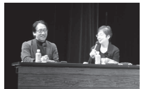
住まいるセミナーの風景(加美商工会 昨年度実施分)

③ 共同で工事を請け負うシステムの検討等 当該地域にお住まいの方は、この機会に是非ご利用下さいますようお願い申し上げます。