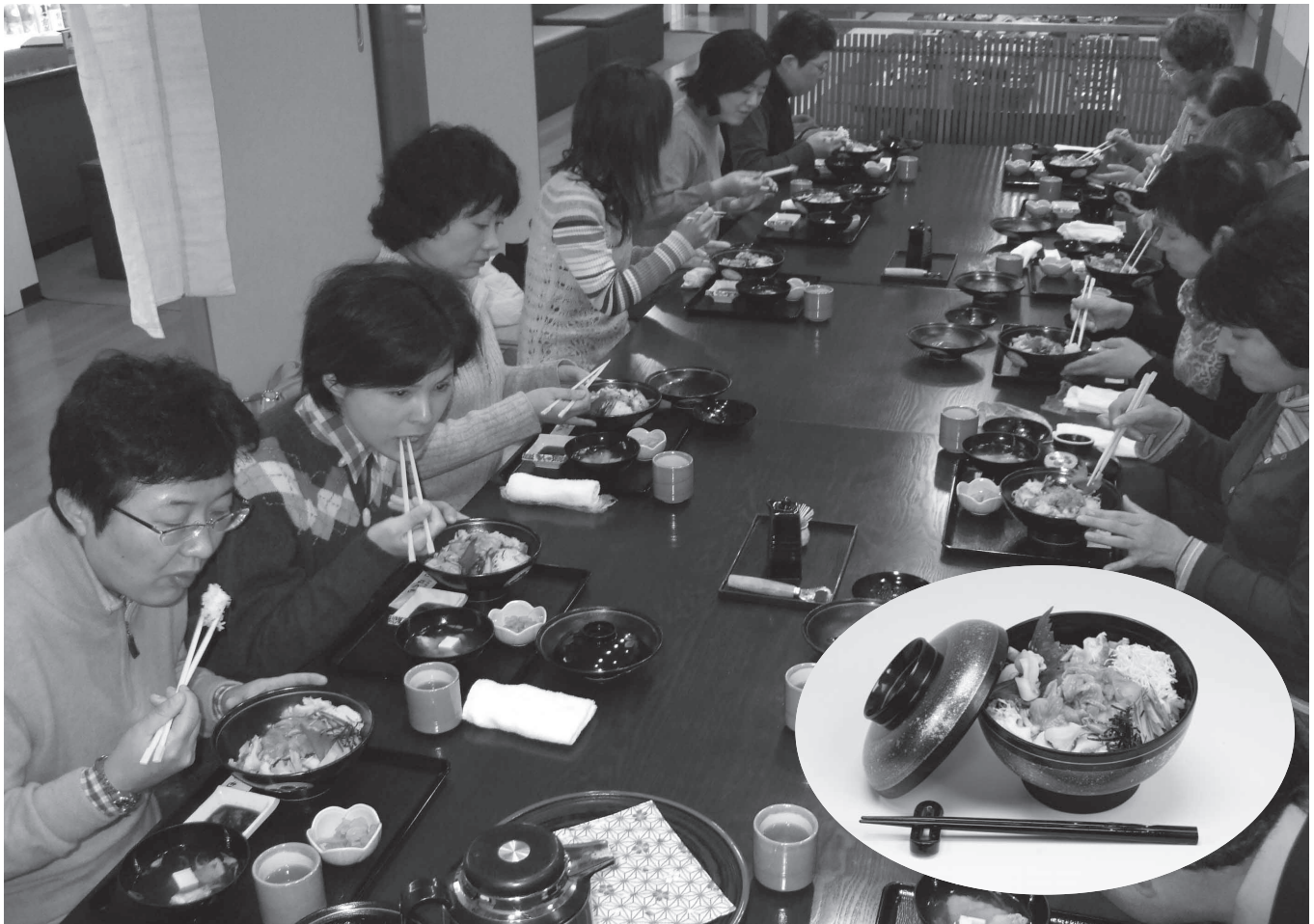
綴じ込んで保管しましょう

発行所 仙台市青葉区上杉一丁目14番2号 宮城県商工振興センター内 宮城県商工会連合会 TEL. 022(225)8751 FAX. 022(265)8009 URL.http://www.miyagi-fsci.or.jp/ 発行者 天 野 忠 正 印刷所 株式会社高橋プリント