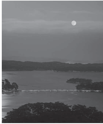
松島湾に浮かぶ中秋の名月

観瀾亭は藩主の納涼、観月の亭として「月見御殿」とも呼ばれ、公式な記録によると藩主・姫君・側室等の松島遊覧、幕府巡見使等の諸国巡回の際の宿泊及び接待用の施設となる「御飯屋」と