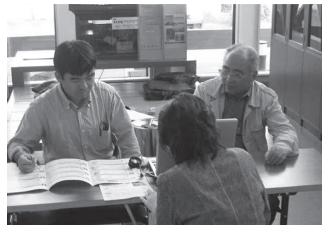
無料相談会の風景(涌谷町商工会 昨年度実施分)

本年度は柴田町商工会と一迫花山商工会がモデル商工会として採択されており、当該地域住民を対象に行政と連携を図りながら次の事業を実施してまい