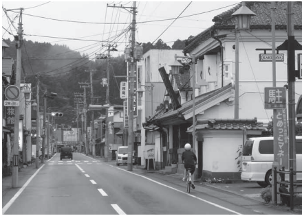
登米町(とよままち)の商店街