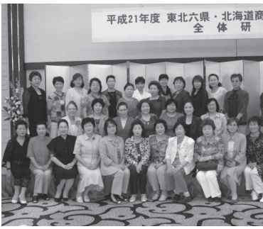
会場にて参加者一同

七月九〜十日の二日間に亘り、秋田市「秋田ビューホテル」を会場に、東北六県・北海道商工会女性部員交流研修会が総勢約四百名参加のもと盛大に開催されました。