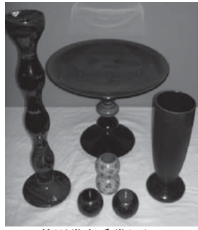
特別賞を受賞した「NARUKOブランド」製品

この「みやぎものづくり大賞」は県内で生産された製品を広く周知することにより、企業の新製品や新技術の開発意欲向上を促すことを目的に平成九年度に創設されたものです。