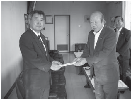
義援金を受取る商工会

六月十四日の早朝に発生した岩手・宮城内陸地震の発生に伴い、会員の皆様による義援金の募金活動が展開された。 九月二十日現在の義援金総額は、会員皆様から四百三十三万七千七百八十八円、他県連及び商工会から百十六万七千六百二十円、青年部・その他から六万七千七百三十六円、合計で五百五十七万三