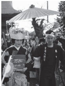
花嫁道中行列風景

ある暮れの十二月十四日、時の神主が、道で見かけた高島田姿の美しい花嫁に魂をうばわれ、恋慕の情に耐えがたく病の床に伏してしまった。そこで村人達が神主の快気を祈ろうと、「島田鬢形」の飴を社に奉納し、神主がその飴を菓がわりに服用したところ、不思議に効験あらたか