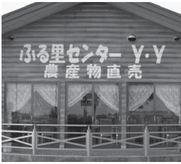
農商工連携の中核施設