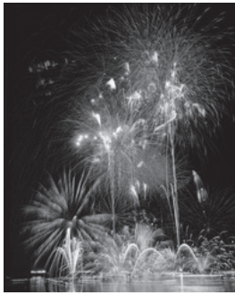
イベント広場の花火風景