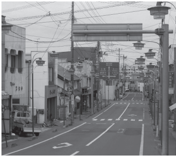
涌谷町商店街風景