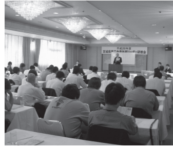
熱心に聞き入る青年部員