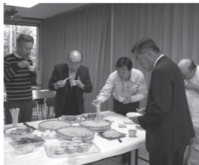
百年前の食事を再現

す。 個店・商店街の魅力をアップすることで、リピーターを増やし、大型店では出来ないおもてなしの心でサービスの提供を行うことを目標に、商店街の活性化を推進していきたいと考えております。