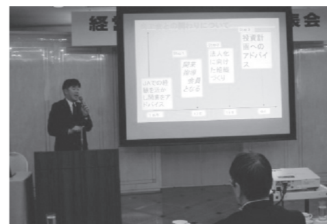
熱心に訴えかける経営指導員

各開催日とも昨年度よりもレベルアップした発表があり、年々経営指導員の小規模事業者等に対する支援スキルが高まっていることが言えます。発表会の最後に、各日の代