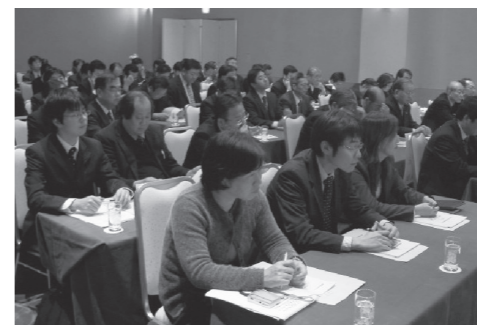
真剣な表情の経営指導員

県内経営指導員の支援スキル及び情報の共有を図ることを目的に仙台サンプラザ（仙台市宮城野区）にて三日連続で開催いたしました。各開催日において広域エリア商工会を代表する経営指導員が持ち時間十分で発表を行いました。