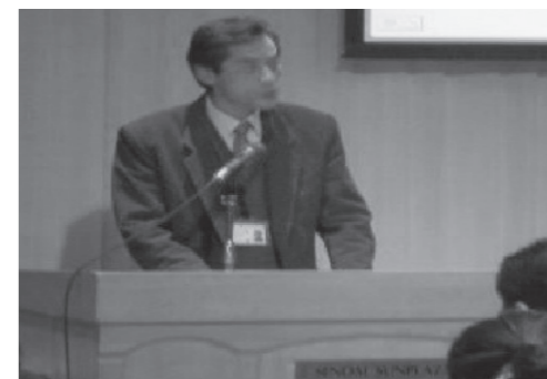
経営革新の発表風景

県内経営指導員の支援スキル及び情報の共有を図ることを目的に仙台サンプラザ（仙台市宮城野区）にて三日連続で開催いたしました。各開催日において広域エリア商工会を代表する経営指導員が持ち時間十分で発表を行いました。