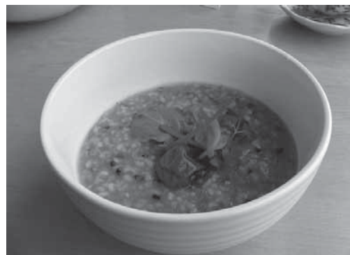
紫黒米のやさしい味

類がこだわりの生産方法で紫黒米を栽培していたことから、紫黒米を使った料理をレストランの看板メニューとして開発。そのメニューの中から紫黒米のお粥を食品製造メーカーと提携してレトルトパック化し、「おもわく粥」として商品化いたしました。今後は、一般消費者はもとより、業務用として旅館及びホテルにも販路を拡大してゆく方針としております。