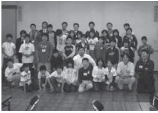
昨年度実施された大河原町商工会青年部の「キッズマーケット」事業は、関係機関からも高い評価を受けて、継続事業に昇華。(本年度は11月3、4日開催。)

県青連では、来年度の提案公募型事業の募集を行っております。 募集は県下商工会青年部等を対象とし(支援・助成上限八十万円)、本年十二月二十五日まで募集し、応募いただいた青年部には、来年二月に予定しております県青連・事業選考会においてプレゼンテーションを行っていただくこととなっております。 その結果、支援助成先に決定されれば、来年四月から応募いただいた事業を早速スタートすることができるよう内容となっております。 是非この制度を利用し「青年部活動の活性化」に繋げていただきたいと思います。 皆様からのたくさんの応募をお待ちしております。