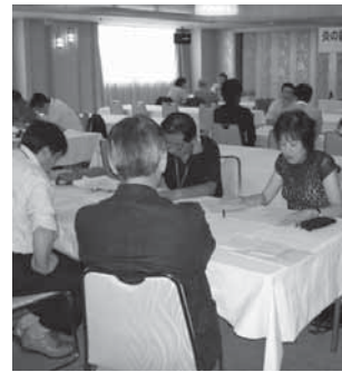
真剣な表情の受講者