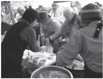
「はっと」の販売風景

今、「地産地消」や「スローフード」そして「食育」などをキーワードに各地で現代の「食」のあり方を見直す動きがあります。 そんな中、地域古来の食文化である郷土料理は、共通のテーマといえるのではないのでしょうか。