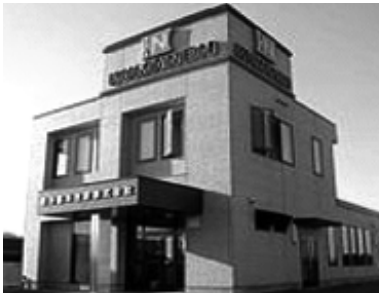
熊谷燃料住設(株)様社屋

企業概要 企業名 熊谷燃料住設株式会社 資本金 二千万円 従業員数 十七人 従業者数 燃料小売業